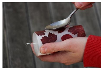
Lena Deflorin /©WWF Scuola